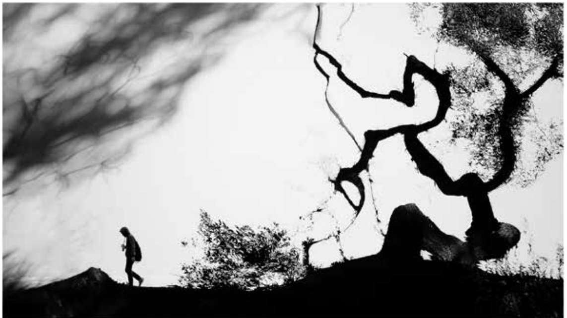
獨行 - 重曝創作