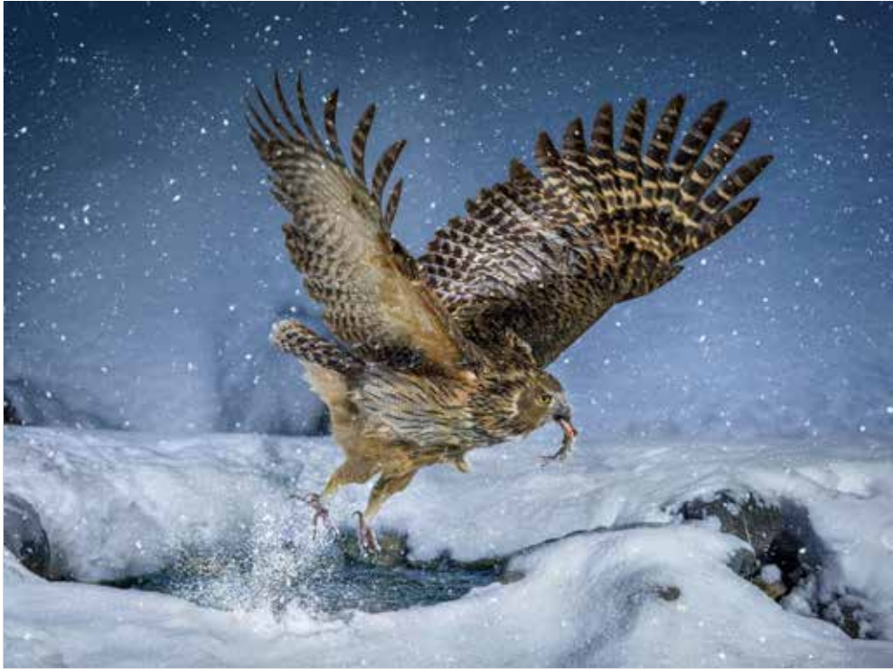
入甲 聶明忠 | 雪魂