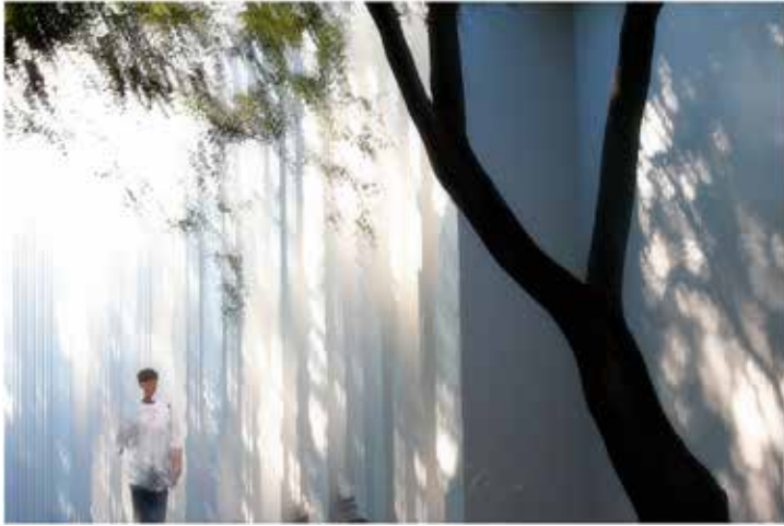
賦別 - 重複曝光