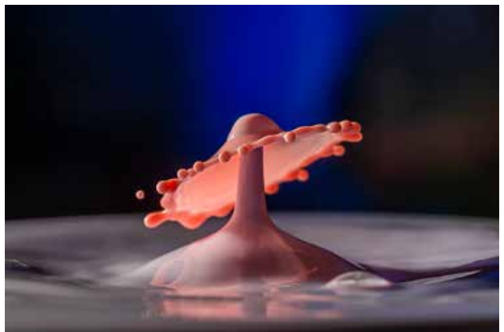
Taiwan 台灣 MAO YIN HUANO | 黃茂寅 Water drop elf