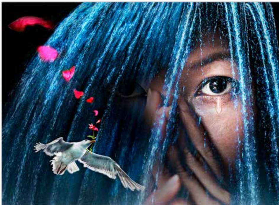
2014臺中國際沙龍 創作組-金牌 感時花濺淚