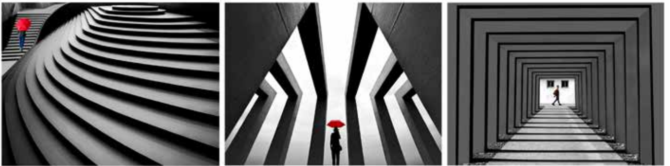
入甲 聶明忠 | 默象

空拍的作品，的確有不同的視覺美感表現，此作缺少了沙龍創作的張力，投龍者應注入創作的理念與技巧的表現，才能得到更好的成績，加油！