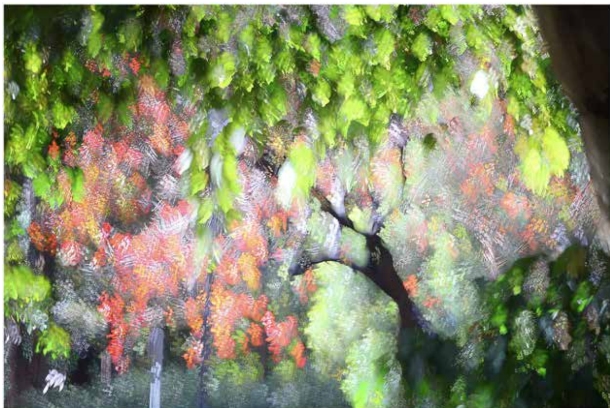
流光溢彩 - 重複曝光