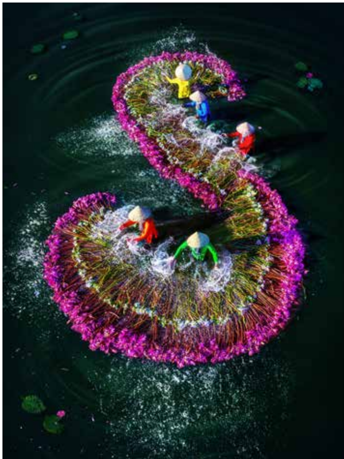
入甲 ▶ 聶明忠 | 湄公花道