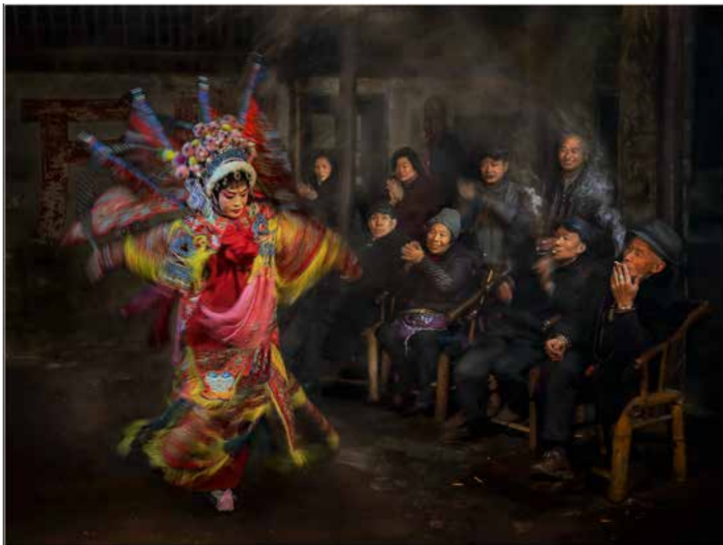
2018磺溪美展全興獎 - 粉墨登場