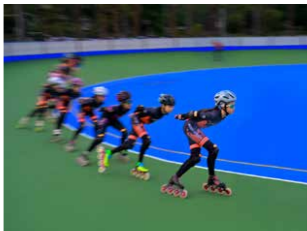
優選 陳憲信 | 領頭羊嗎