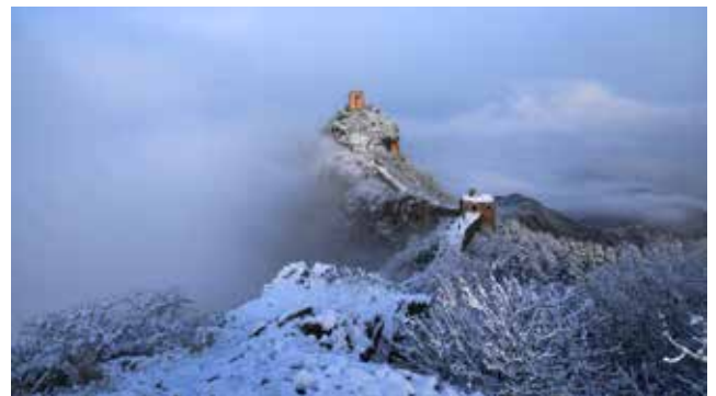
APU BM 銅牌獎