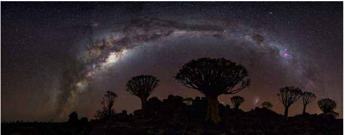
PSTC GM 金牌獎 Canada 加拿大 | ZHUGANG~ZHENG | Milky way Above Quiver tree Forest