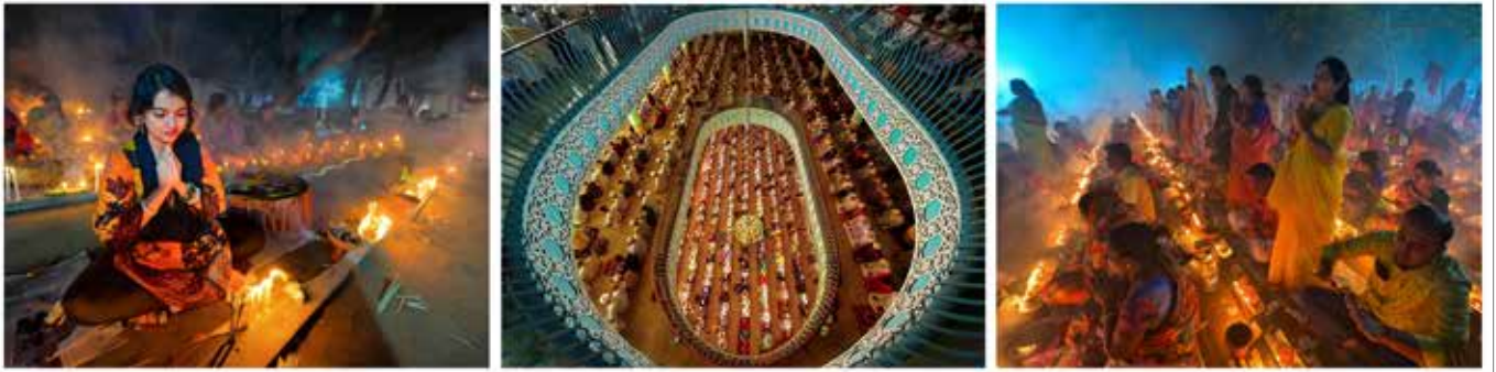
入甲 聶明忠 | 點燈祈福