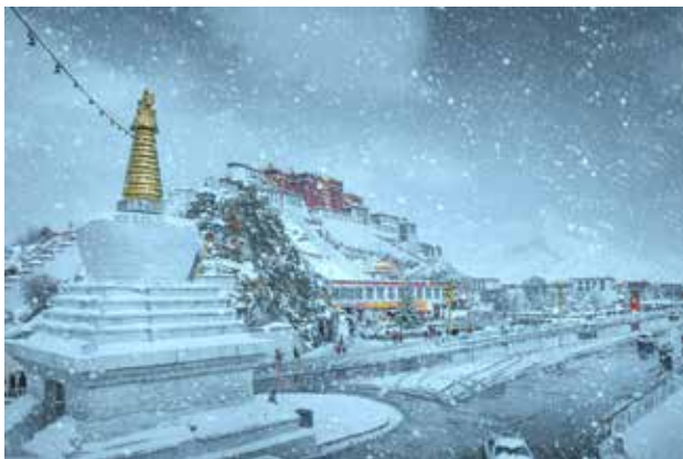
APU BM 銅牌獎