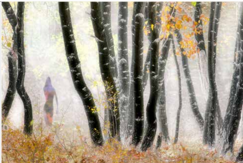
2018新北美展入選 伊人芳蹤