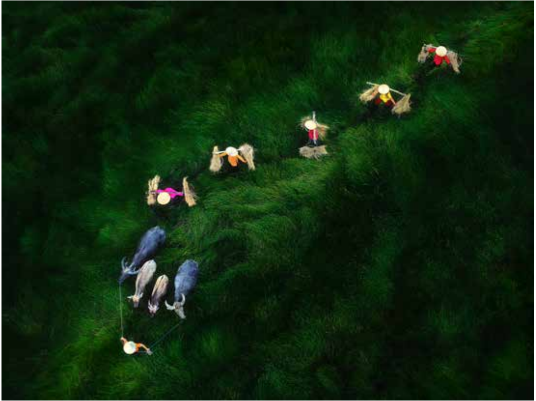
入乙 聶明忠 | 綠野鄉情

空拍的作品，的確有不同的視覺美感表現，此作缺少了沙龍創作的張力，投龍者應注入創作的理念與技巧的表現，才能得到更好的成績，加油！