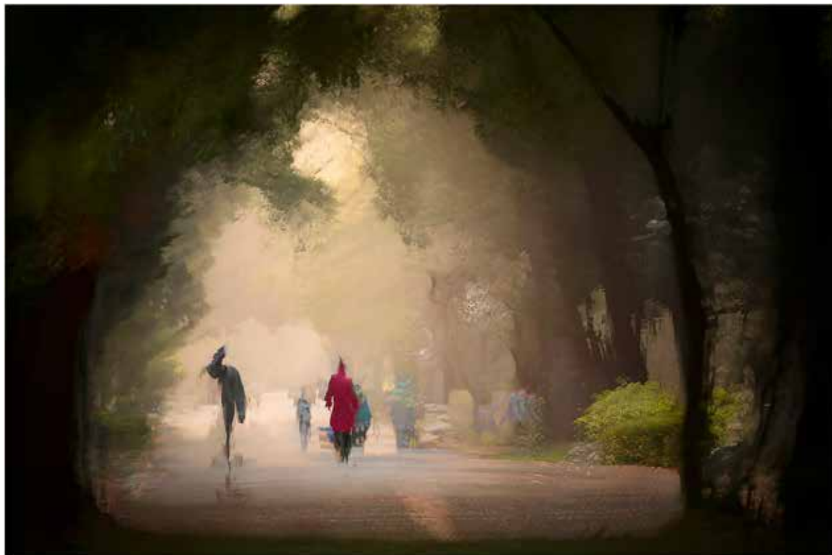
微光中 - 重複曝光