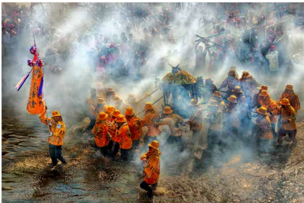
2017磺溪美展入選 - 虎爺衝水路