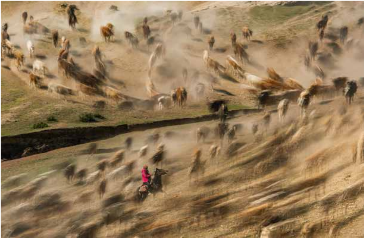
PSTC GM 金牌獎 China 中國 | YIPING WAN | 万贻平 | On the migration