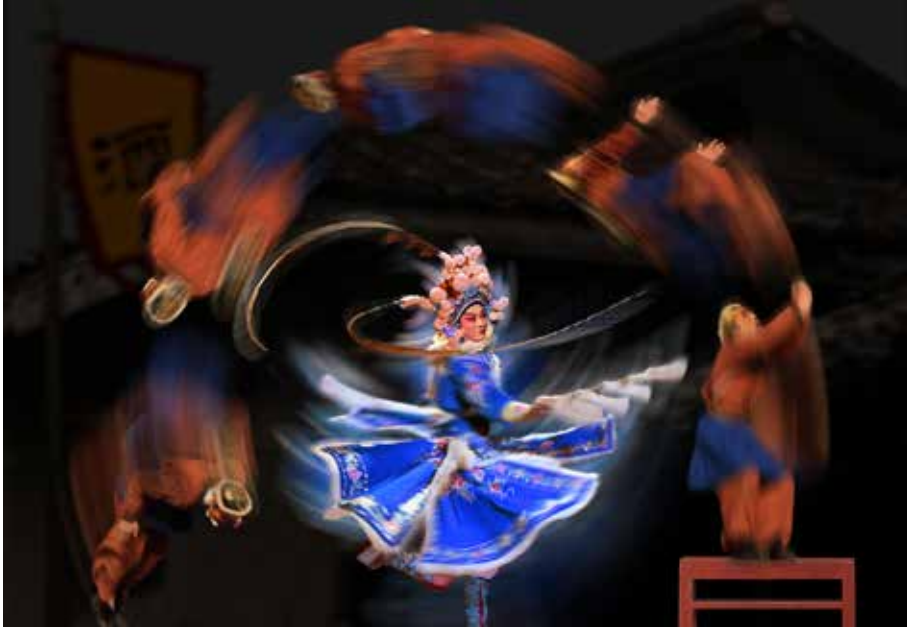
GPU GM 金牌獎 China 中國 | XIAOPING MAO | 冒小平 | Excellent as the male