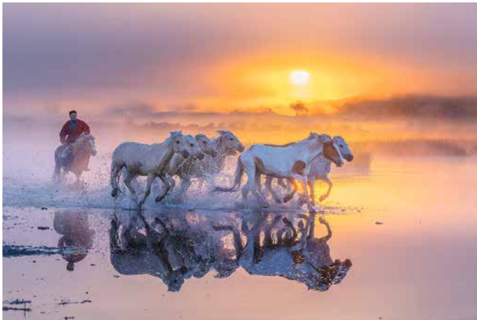
PSTC SM 銀牌獎 Hong Kong 香港 | VOON WAH WONG | Ride at sunrise