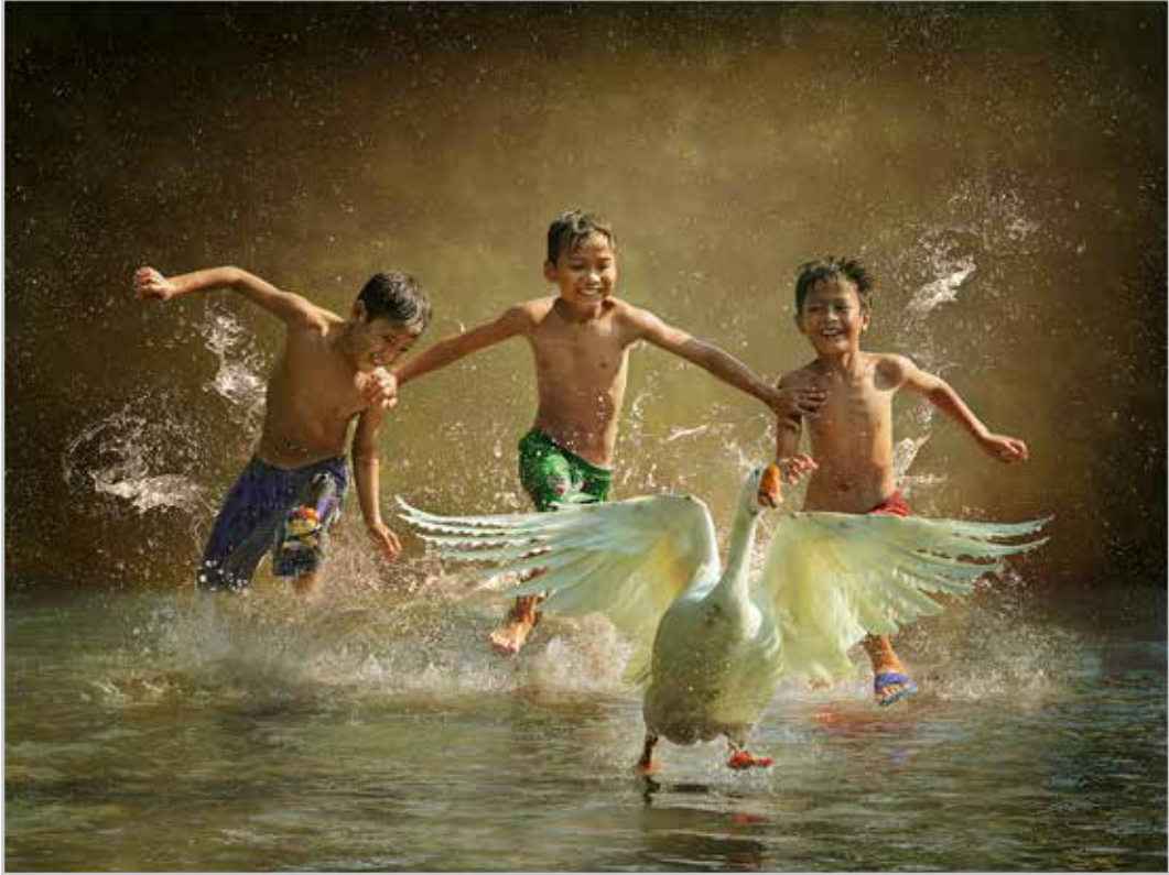
沙龍照 - 抓鵝樂