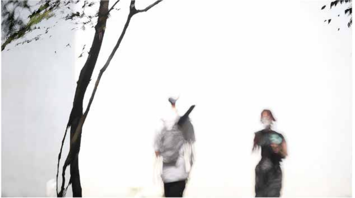
遇 - 重複曝光