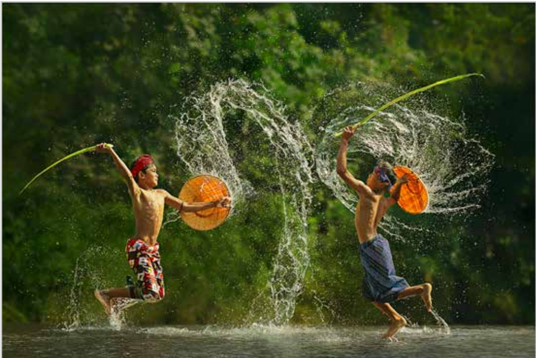
沙龍照 - 踏水練劍