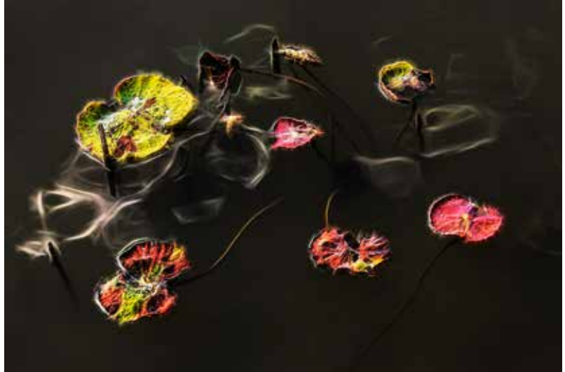
China 中國 HUAMING ZHAO | 赵华明 Residual Lotus Soul