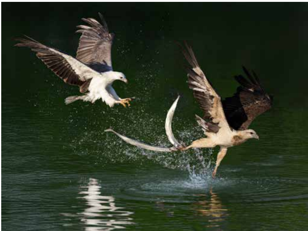
入甲 陳麗華 | 搶食