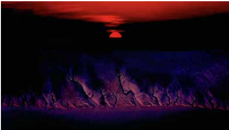
GPU SM 銀牌獎