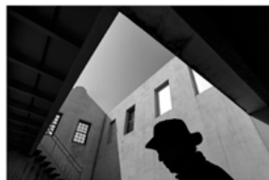
心象 - 孤獨的儀式