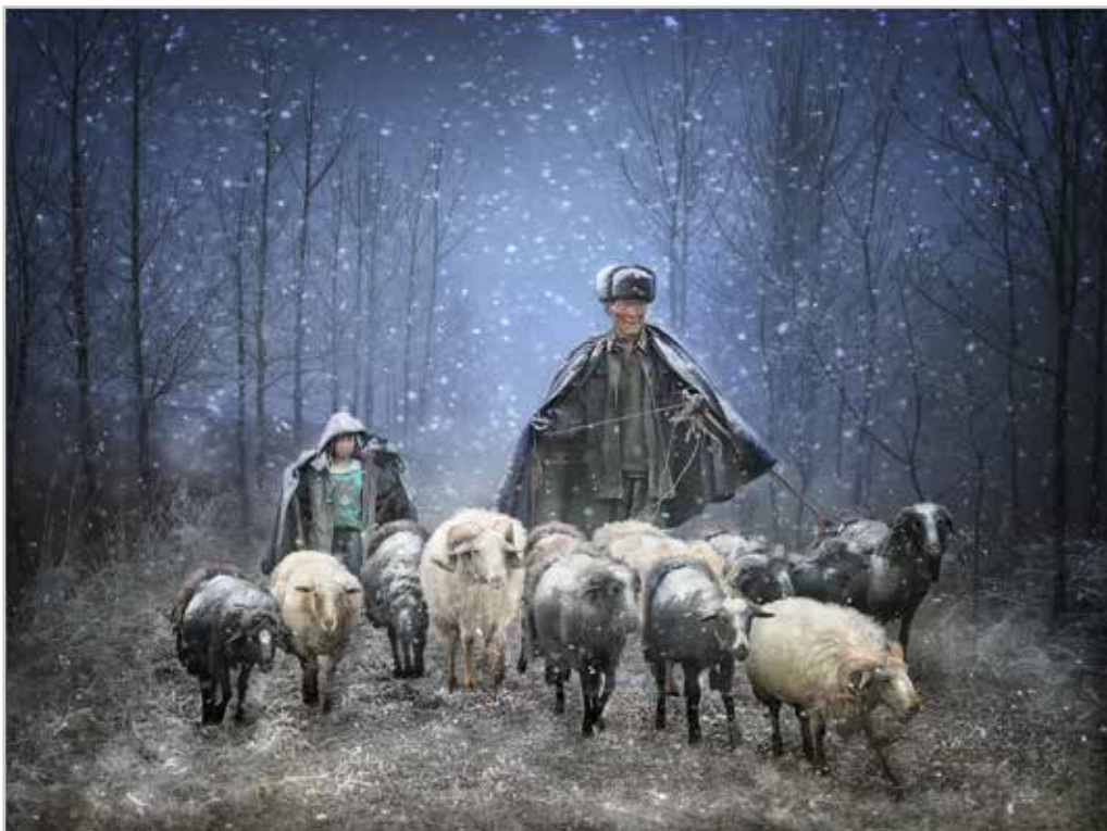
沙龍照 - 風雪途中