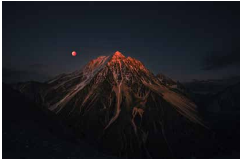
China 中國 YI DING | 丁毅 Red moon over holy mountains