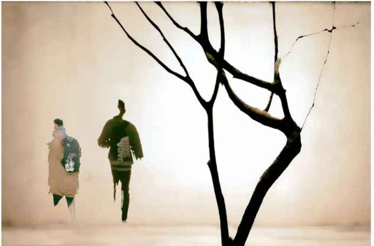
離別 - 重曝創作