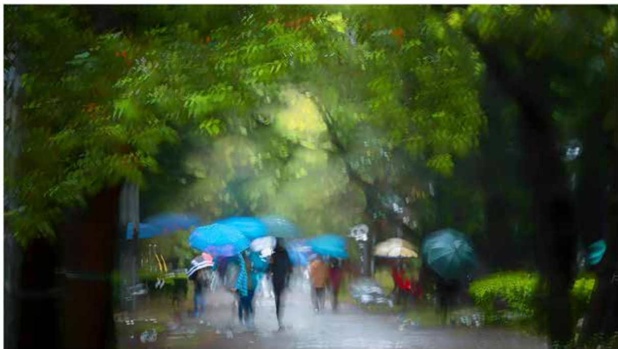
雨中德耀路 - 重複曝光