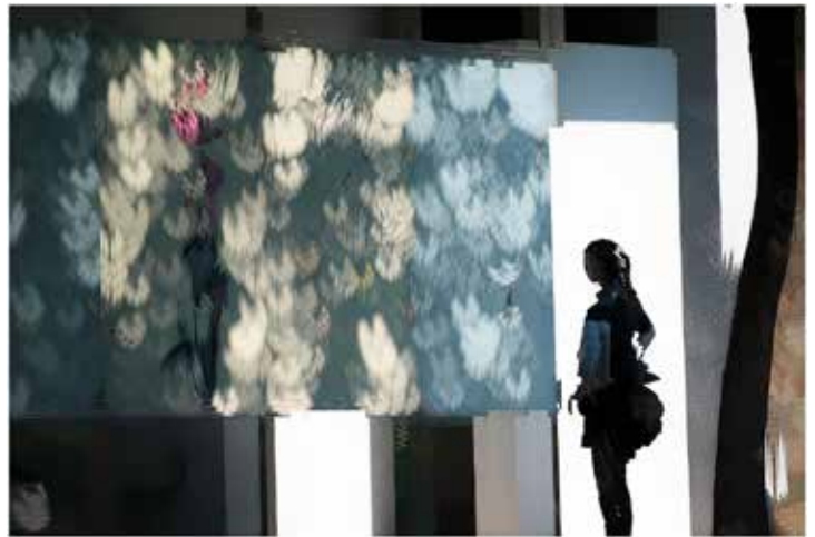
光與影 - 重複曝光