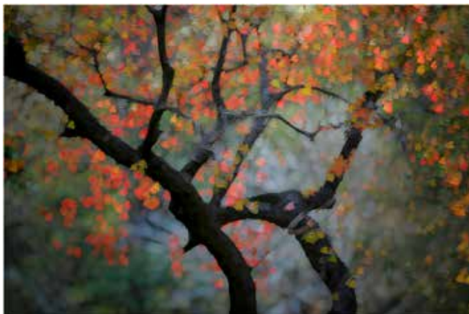
東海烏柏重複曝光-2