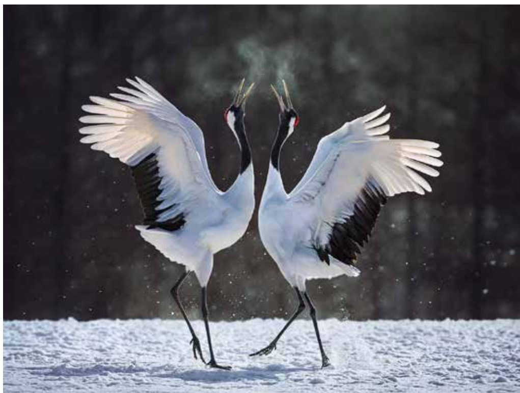
入甲 聶明忠 | 鶴語

丹頂鶴姿態優美，捕捉瞬間展翅美姿，晨間冷空氣下呼的襯托喊噴出白白的氣息，在暗背景下格外明顯。